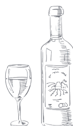
BEVANDE E VINO Menu