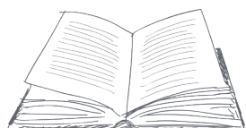
MENU English | Deutsch